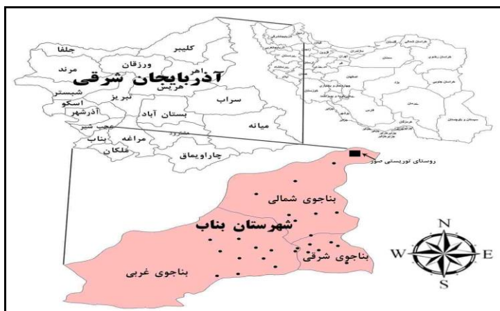
شکل ۱- موقعیت جغرافیایی روستای صور

کیم ۲ (۲۰۰۵) در پژوهشی نقش گردشگری به عنوان محرکی برای از بین بردن مشکلات اقتصادی در جامعه روستایی کره را مورد بررسی قرار داده و به این نتیجه می‌رسد که دولت و بازار نقش مهمی در مشارکت برنامه‌های توسعه گردشگری در روستاهای این کشور دارند. آلمیدا زامبران ۳ در سال ۲۰۱۰ در مقاله «اثرات محیطی و اجتماعی اکوتوریسم در جزایر کاستاریکا» با در نظر گرفتن نقش اکوتوریسم در حفظ محیط طبیعی و رضایت جامعه محلی به اثرات توسعه آن در جزایر یادشده پرداختند. ژانگ ۴ (۲۰۱۲) در پژوهشی با عنوان «استراتژی‌های توسعه گردشگری روستایی» با استفاده از مدل SWOT به اتخاذ استراتژی‌های توسعه گردشگری روستای سوژو ۵ در کشور چین پرداخته است. در این پژوهش با تأکید بر ترکیب منابع داخلی و خارجی و مزایا و نقطه ضعف‌های روستای سوژو، استراتژی توسعه پایدار گردشگری این روستا تدوین نشده است. راست‌قلم (۱۳۸۸) در مقاله‌ای با عنوان «بررسی مزیت‌ها و محدودیت‌های توسعه کانون‌های گردشگری با استفاده از تحلیل سوات (مطالعه موردی: کانون‌های گردشگری شهرستان شهرکرد)»، به این نتیجه