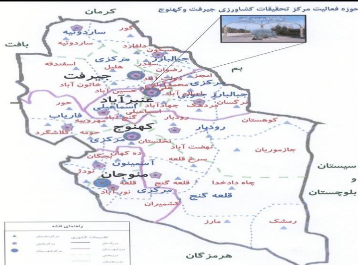
شکل ۱- موقعیت و پراکندگی مرکز دهستان‌های مورد مطالعه