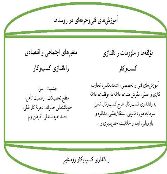
شکل 1- چارچوب نظری پژوهش

دوره‌های آموزشی شرکت می‌کنند و بیشتر این افراد زمانی که وارد دنیای کسب‌وکار می‌شوند، برای راه‌اندازی کسب‌وکار مستقل تلاش می‌کنند. افزون بر این، آموزش‌های فنی و حرفه‌ای علاوه بر تأثیر بر جنبه‌های مهارتی، برخی از مؤلفه‌های شخصیتی و عمومی مورد نیاز برای راه‌اندازی کسب‌وکار در کارآموزان را نیز تقویت می‌کنند. همچنین، ترکیب این مؤلفه‌ها با ویژگی‌های فردی و حرفه‌ای کارآموزان در نهایت راه‌اندازی کسب‌وکار را شکل می‌دهد که در این تحقیق در پی شناسایی ملزوماتی برای راه‌اندازی کسب‌وکار هستیم که توسط آموزش‌های فنی و حرفه‌ای روستایی قابل دستیابی است؛ براین اساس، چارچوب مفهومی به صورت زیر طراحی شده است: