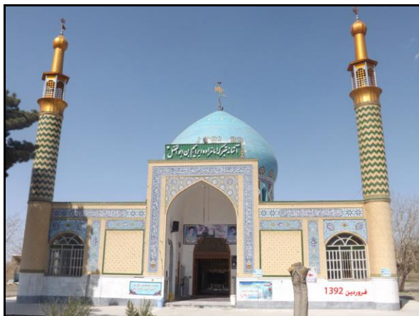
شکل ۲- آستانه متبرکه امامزاده ابراهیم بن عباس (ع) در