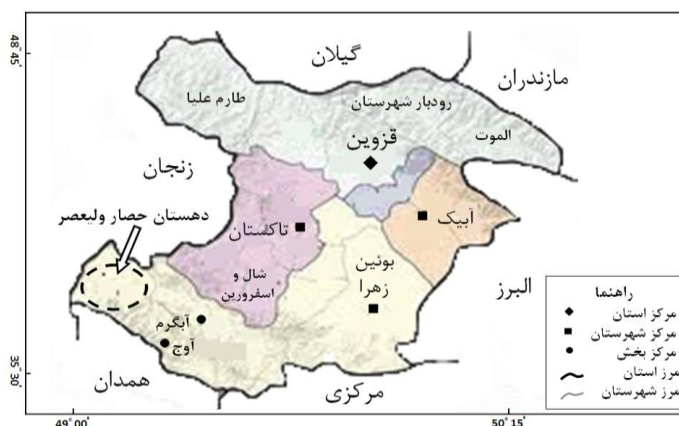
شکل ۱. موقعیت منطقه مورد مطالعه در استان قزوین

مطالعه هولاند و همکاران (۲۰۰۳، ص. ۲۳) در کشور اوگاندا نشان می‌دهد توسعه فعالیت‌های گردشگری نیمه‌وقت و پاره‌وقت غیرزراعی با هزینه راه‌اندازی پایین و تولید محصول قابل ارائه در بازارهای محلی، به‌عنوان منبع مهمی برای ایجاد اشتغال و کسب درآمد در مناطق روستایی، نقش مهمی در تنوع‌بخشی به اقتصاد مناطق روستایی داشته است. مطالعه بارلیبائو و همکاران، (۲۰۰۹، ص. ۶۳۹) در مناطق کشاورزی روسیه نشان می‌دهد توسعه گردشگری روستایی به‌عنوان اولویت و استراتژی متنوع‌سازی اقتصادی، از طریق توسعه شاخه‌های جدید فعالیتی و تخصصی شدن فعالیتهای کشاورزی مانند زراعت، دامداری، پرورش اسب و گله‌داری گوسفند مطرح